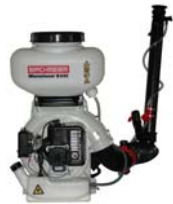
Microniseur B 245