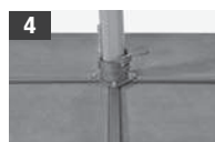
Ständerkreuz (ohne Platten) Croix de support (sans plaques) Croce del supporto (senza piastre) Cross base (without panels)

Position of the crank to rotate part of the parasol right and left