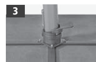
Drehfuss Support rotatif Supporto girevole Rotate Bearing

Crank for opening/closing/rotating head for tilting downwards