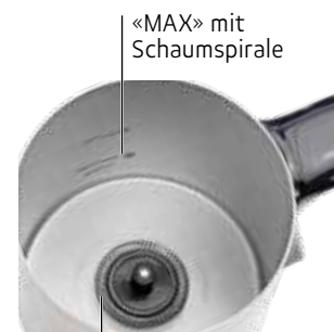
«MAX» mit Schaumspirale