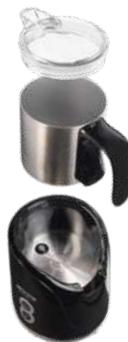
Quirl mit Schaumspirale