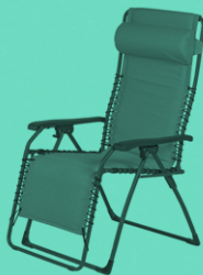
MOVIDA XL SOFT