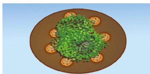
Bokashi zwischen Bäume/Sträucher