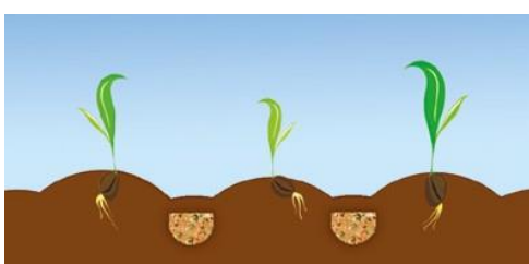
Bokashi zwischen Pflanzen