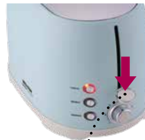
Knopf zum Einschalten nach unten drücken