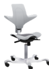
gris clair 4015.130.000.81*