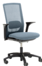
bleu clair 4015.129.000.41*