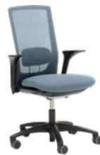
bleu clair 4015.129.000.41