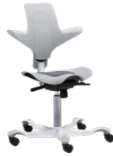
gris clair 4015.130.000.81